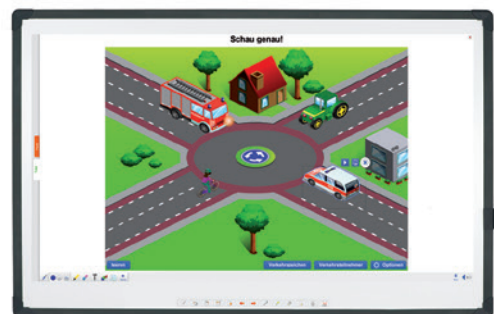
Pro Kategorie ein großes Angebot an Anwendungen.