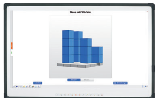
Pro Kategorie ein großes Angebot an Anwendungen.