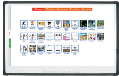
Pro Kategorie ein großes Angebot an Anwendungen.

Mehr Informationen erhalten Sie auf www.heutink-ict.de oder nehmen Sie Kontakt mit uns auf unter 0800 – 240 46 06. Gerne können Sie und auch eine E-Mail an info@heutink-ict.de senden.